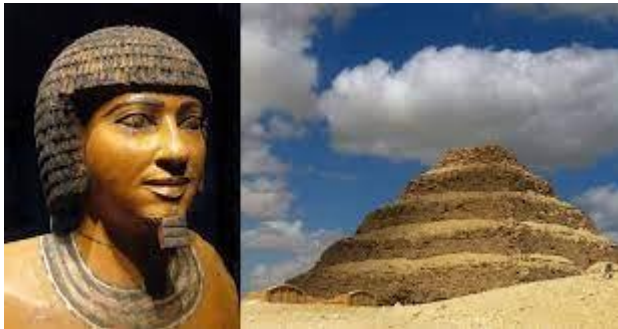
Inhotep e a pirâmide de saqqara

Um livro maravilhoso que sugiro a todos lerem se chama : Caibalion, escritos por Inhotep ou Hermes trimegistros, que foi um grande sábio egípcio considerado o verdadeiro pai da medicina ( e não Hipócrates), e que construiu as pirâmides e seus discípulos compartilharam as leis que ele compartilhou conosco chamadas leis herméticas e que indubitavelmente são maravilhosas leis espirituais divinas que compartilho neste livro .