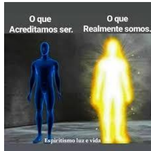
Corpo físico e espírito

Apenas relembrando que o Homem encarnado integral é dual, composto de espírito imortal ( onde se situa a mente que é eterna ) e corpo físico ( onde se encontra o cérebro que é transitório ).